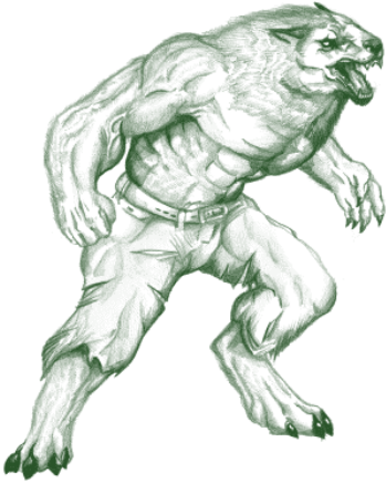
(noar n foabel van Aesopus)

n Daif huurde ais n koamer ien n haarbaarg en bleef doar n zetje om aan te kieken of e wat gappen kon om logies te betoalen. Dou e der n poar doagen lozaaierd haar en nog niks van zien goading vonden haar, zaag e krougholder mit n schiere nije jas aan veur haarbaarg zitten. Daif lait zuk ook deel en proatte wat mit hom. Dou t gesprek wat hottjede, gapte daif n moal slim en begon as n wolf te hoelen. Krougholder vroug waarom of hai zo bot hoelen dee.