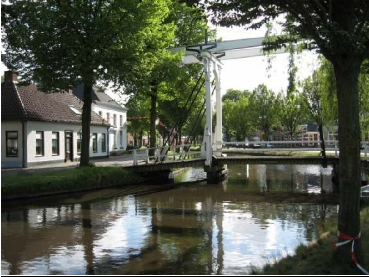
Pekelderdaip bie Van Weringsklap